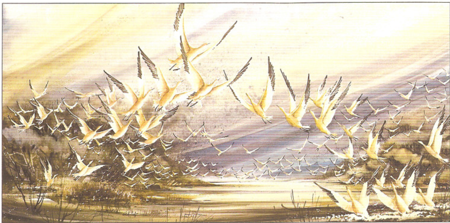
| Chantal Angers, Les grandes envolées... Échos inoubliables , aquarelle, 12 x 29,5