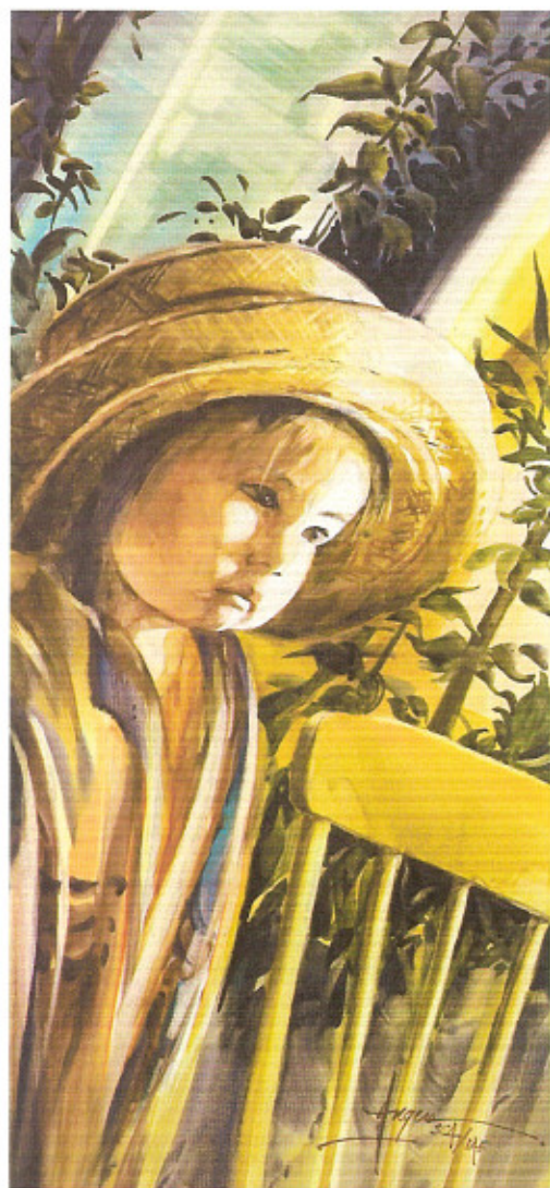
Chantal Angers, Plus grand que soi , aquarelle, 20 x 10